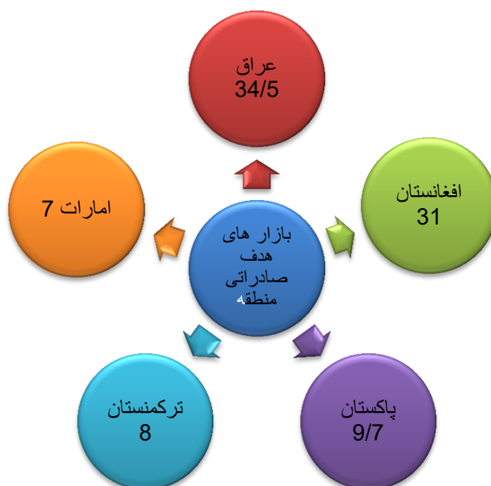
نمودار کشورهای هدف صادراتی ایران در سال ۱۳۹۶